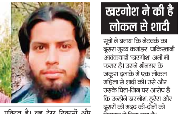
सूत्रों ने बताया कि नेटवर्क का दूसरा मुख्य कमांडर, पाकिस्तानी आतंकवादी 'खरगोश' अभी भी फरार है। उसने श्रीनगर के जकूरा इलाके में एक लोकल महिला से शादी की। उसे और उसके पिता-जिन पर आरोप है कि उन्होंने खरगोश, हुरैरा और दूसरों के मदद की-दोनों को हिरासत में लिया गया है। गिरफ्तार किए गए लोगों में पिता समेत तीन लोकल लोग शामिल हैं। एक सीनियर पुलिस अधिकारी ने बताया, यह नेटवर्क कश्मीर, जम्मू, हरियाणा, पंजाब, राजस्थान और दिल्ली में काम करता था, जिससे विदेशी आतंकवादियों को पकड़े जाने से बचने और ऑपरेशन करने में मदद मिलती थी। पृष्ठभूमि में कश्मीर घाटी में सांघियों से भारी मात्रा में हथियार मिले, जिसमें पांच एके राइफल, दो पिस्तौल, छह वेनेड और गोला-बारूद शामिल हैं। घटने में पिता-बेटी की जोड़ी की जरूरत से एक बड़ा कैश बरामद किया गया।